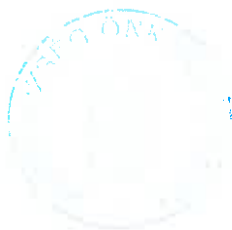
Asztalos István polgármester